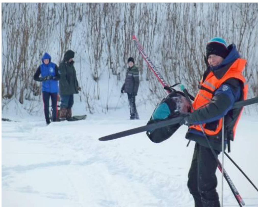
Переправа через р. Тобол