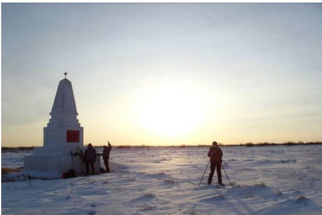
Памятник «Жертвам Революции»